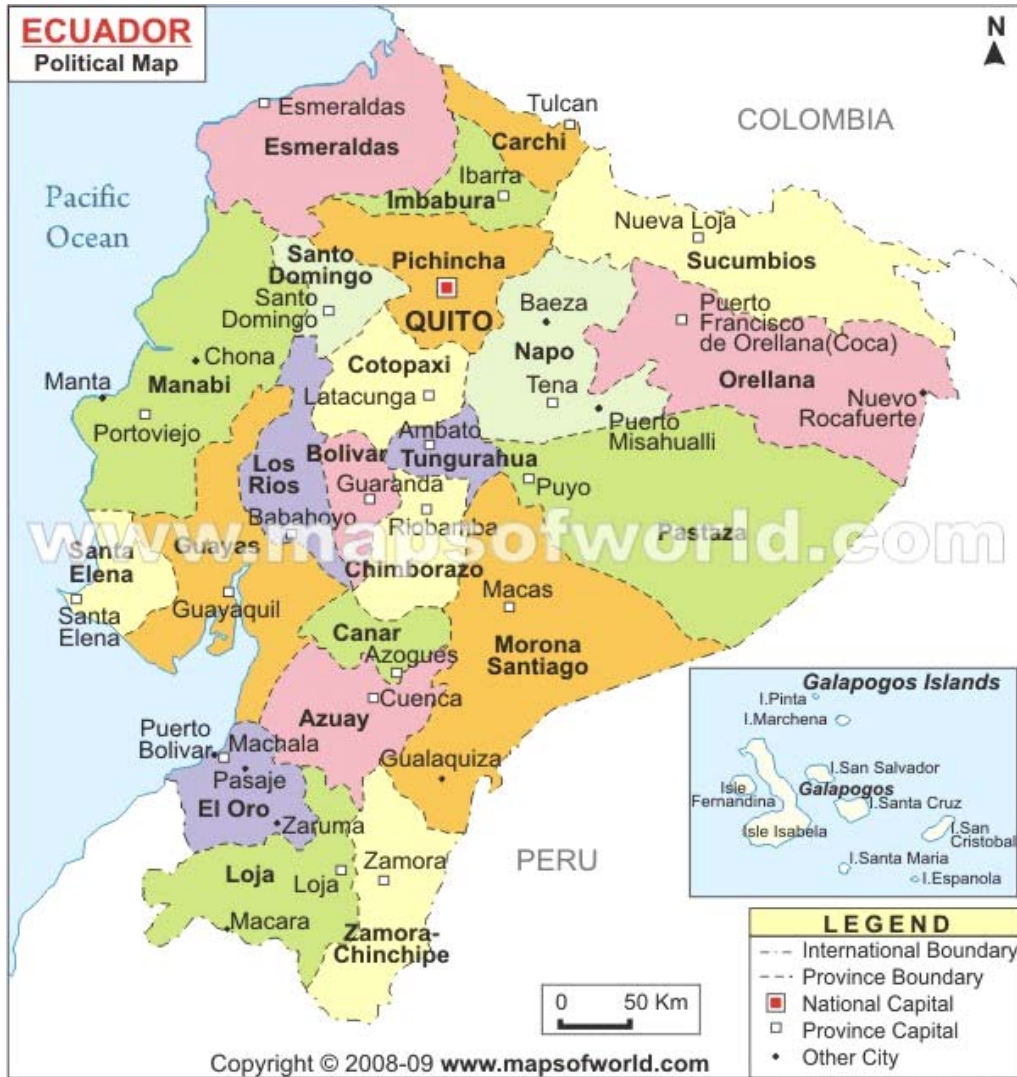
Mapa 1. Ubicación de la Provincia del Azuay